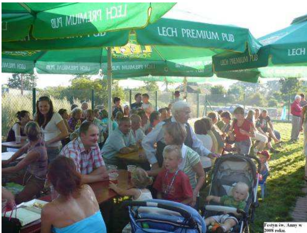
Festyn św. Anny w 2008 roku.