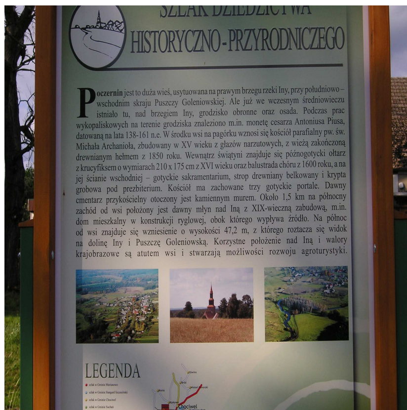
Tablica informacyjna „Szlaku Dziedzictwa Historyczno-Przyrodniczego”