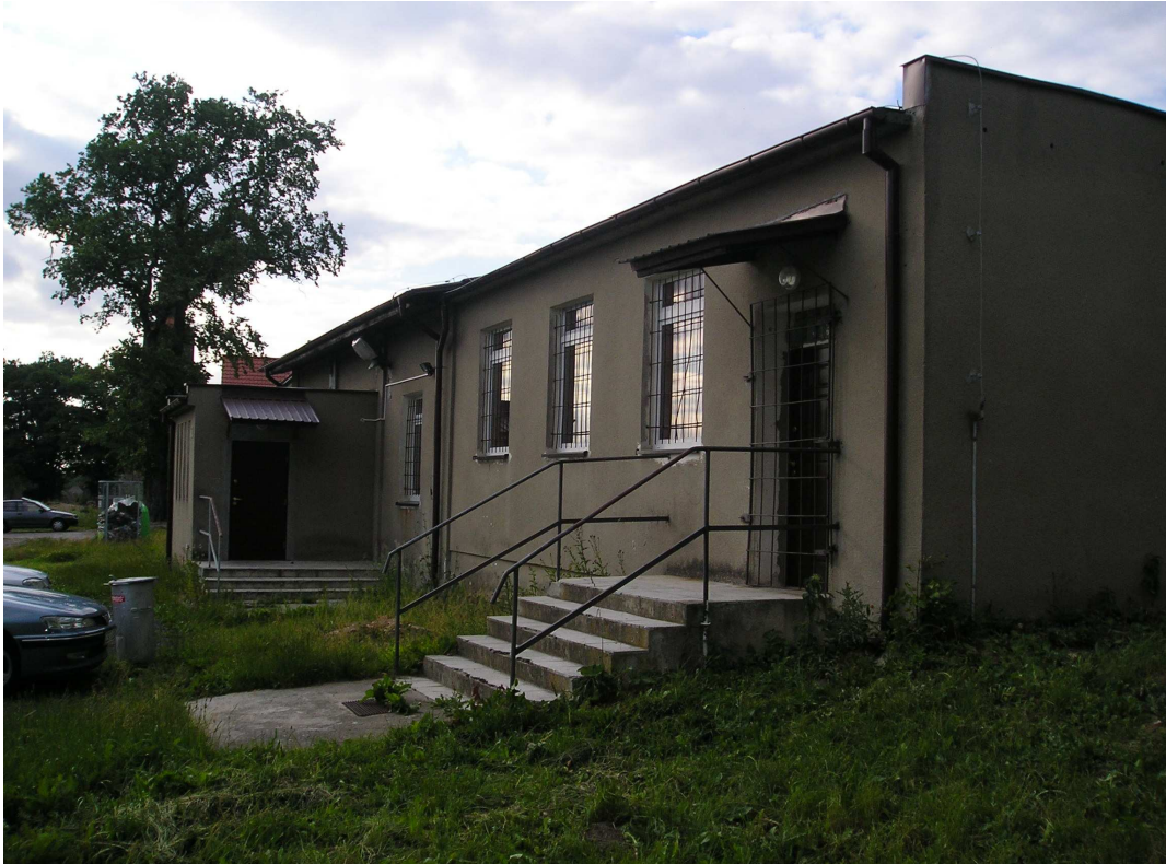
Świetlica wiejska w Poczerninie