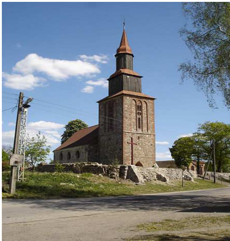
Kościół pw. św. Michała Archanioła w Poczerninie

Około 1,5 km na północny-zachód jest dawny młyn nad Iną z XIX-wieczną zabudową, m.in. dom mieszkalny w konstrukcji ryglowej, obok którego wypływa źródło. Osada położona nad rzeką Iną, po jej wschodniej stronie, w odległości ok. 1 km na południe od niedokończonej przez Niemców autostrady Berlin-Królewiec, w połowie odcinka Szczecin - Chociwel. Zachował się średniowieczny plan ulicówki.