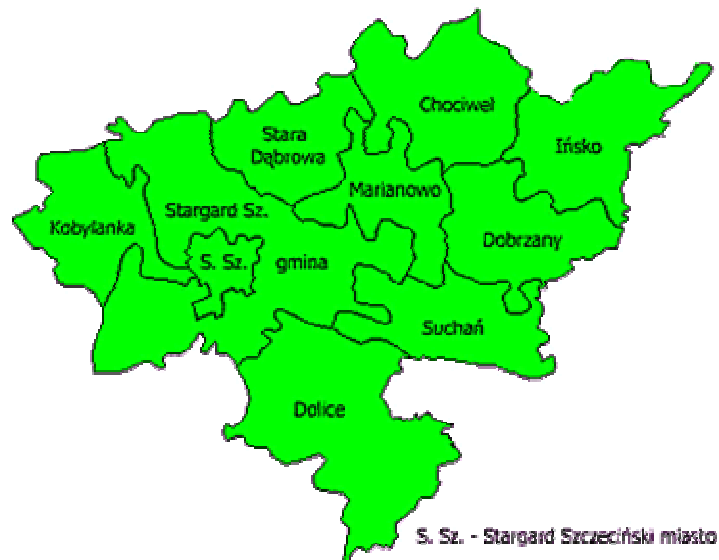
Mapa powiatu Stargardzkiego

Granice administracyjne gminy na przeważającej długości są granicami sztucznymi, jedynie część zachodniej granicy wyznaczona jest zachodnią linią brzegową Jeziora Miedwie. Część południowej granicy biegnie wzdłuż koryta Iny, a część granicy północno-wschodniej - wzdłuż koryta Małki. Charakterystyczną cechą położenia gminy jest fakt, że w skład jej